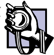
Photo des finissants (es) 2005